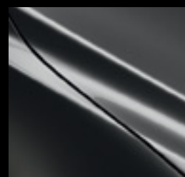
GRI MACHINE (46G)